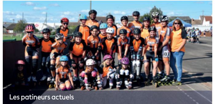
Les patineurs actuels

C'est ainsi qu'en 1972, le comité des fêtes de Connerré ne fait pas moins que d'organiser les championnats de France sur route !