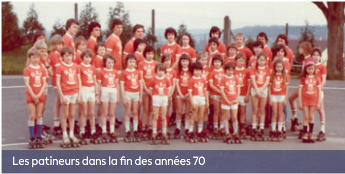
Les patineurs dans la fin des années 70