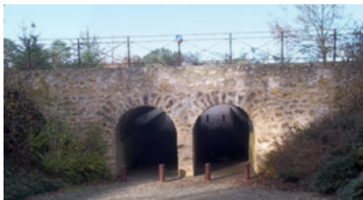
Le même lieu de nos jours (tunnel du circuit près du parc des Sittelles).