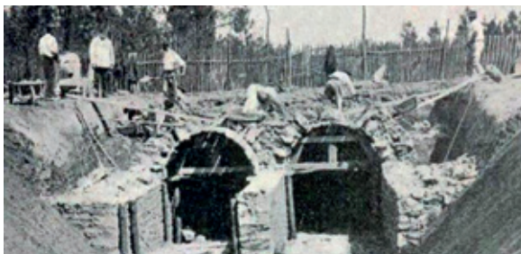
Construction du passage souterrain des tribunes du GP de l'ACF 1906 pour la libre circulation des spectateurs servant aussi de pont pour le circuit.

À l'occasion du centenaire des 24h du Mans, et sous l'impulsion de la municipalité de Saint-Mars-la-Brière, de nombreuses animations seront organisées les 27 et 28 mai prochains dans les communes situées sur le parcours du 1 er grand prix de France automobile qui a eu lieu les 26 et 27 juin 1906. Ce grand prix a en effet été à l'origine de la création des 24h du Mans en 1923.