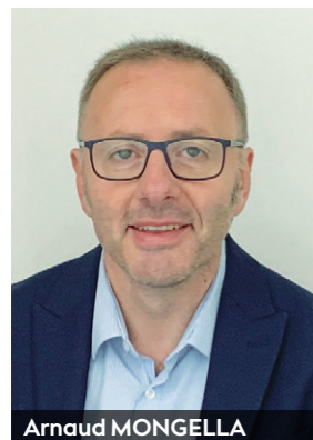
Arnaud MONGELLA Maire de Connerré